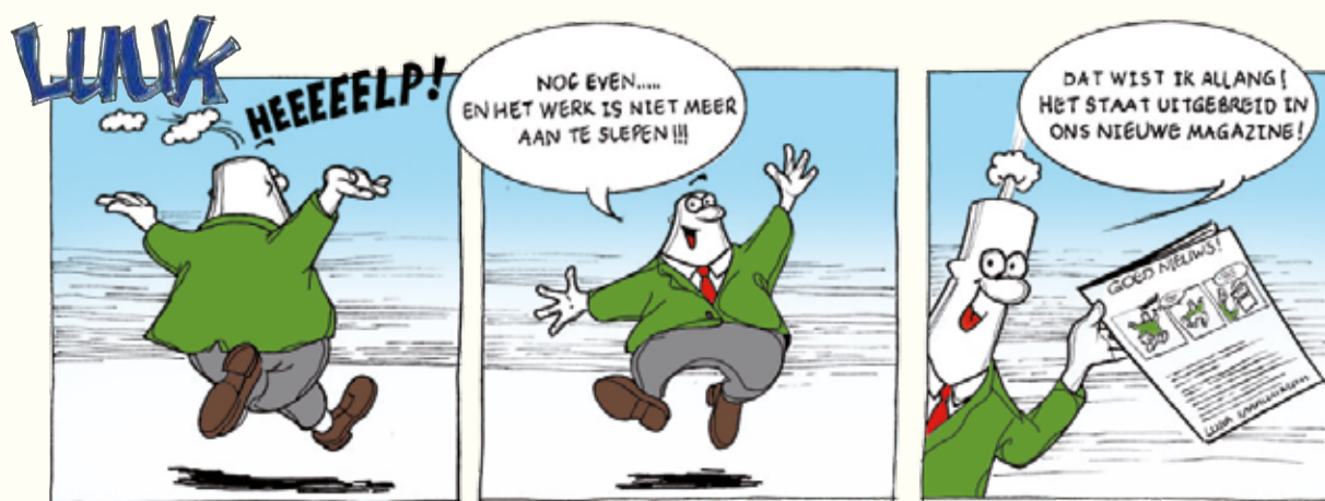
ERWIN DE WERD ZOETERMEER