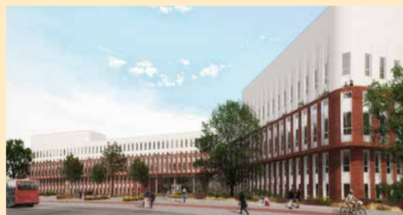
(bron: Mecanoo architecten / VORM)

Op deze manier levert Kerssens Luchtbehandeling b.v. een hoogwaardig kanaalsysteem op wat voldoet aan alle gestelde eisen, en wat meehelpt aan het doel een zo hoog mogelijk comfort te realiseren bij een zo gering mogelijk energiegebruik.