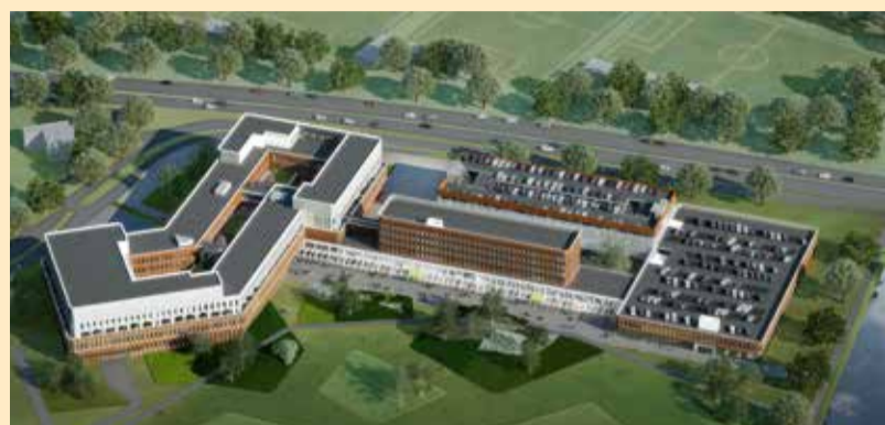
Nieuwbouw Zaans Medisch Centrum (bron: Mecanoo architecten / VORM)

BIM, er is al ontzettend veel over geroepen en geschreven; BIM is hot! Ieder bedrijf in de bouw- en installatiewereld is bekend met het verschijnsel BIM. De een ziet het als dé oplossing voor alle voorkomende problemen in een bouwproces, de ander ziet het vooral als een last waaraan helaas gehoor gegeven moet worden, omdat je anders niet meer meedoet.